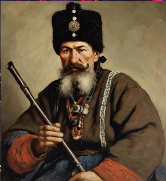
ОРИГІНАЛ Картина «Козак Мамай» (XVIII ст.). Полтавська обл. Музей Івана Гончара

Зображення створені за допомогою сайту з ШІ - https://beta.dreamstudio.ai/